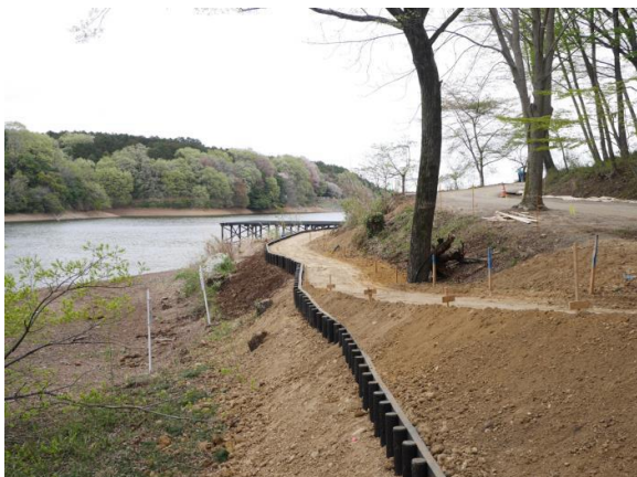
③（メツァビレッジ貸ボート乗り場付近）