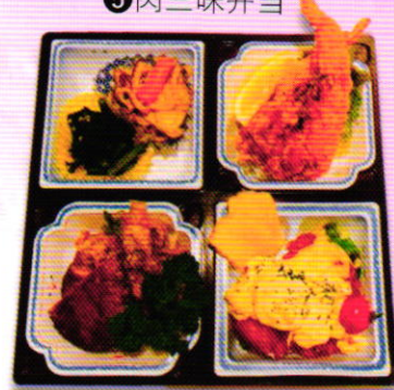
⑥ 2人前オードブル ※内容は日替わりです