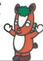
飯能市イメージキャラクター 夢馬（むーま）

赤ちゃんもあそべるおもちゃを用意しています。 たくさんからだを動かしてあそびませんか？ 手あそびや絵本のよみきかせもしています！おまちしています。