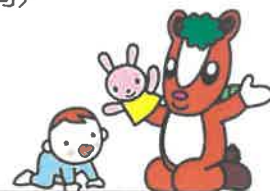
飯能市イメージキャラクター 夢馬（むーま）