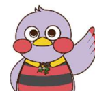
埼玉県のマスコット「さいたまっち」