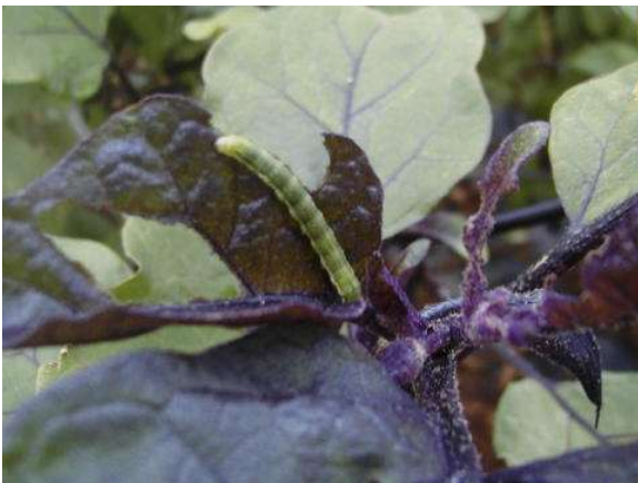
写真1 オオタバコガ幼虫による葉の食害