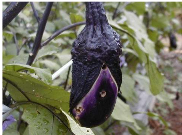
写真2 オオタバコガ幼虫による果実の侵入痕