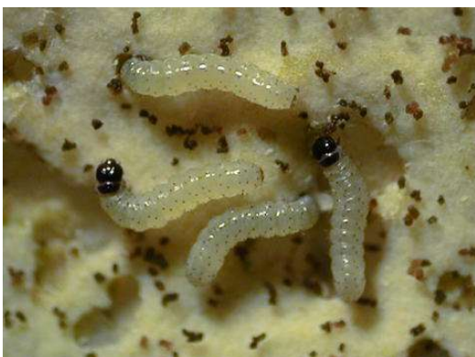
写真1 シロイチモジヨトウ若齢幼虫 (体長約2mm)