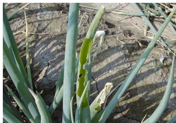
写真2 シロイチモジヨトウによる被害葉