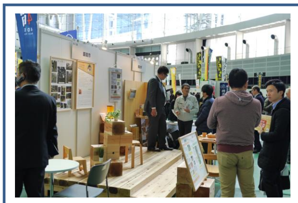
平成 29 年 2 月 8 日 (水) 埼玉県農商工連携フェア 西川材PRブース (フェア全体の来場者数 3,871 名)

大消費地を抱える首都圏を対象に西川材の魅力を発信するため、さいたまスーパーアリーナで開催された「埼玉県農商工連携フェア」、及び「横浜三塔の日 2017」に合わせ様々な催し物が行われた横浜市開港記念会館においてアンテナショップ(西川材PRブース)を開設し、西川材を使用した家具や玩具などの展示・販売を行いました。