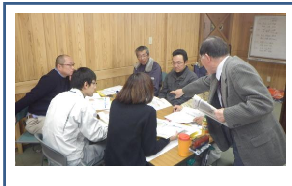
平成 29 年 1 月 17 日（火） 森林作業安全技術講習会 （林業センター 参加者数 30 名）