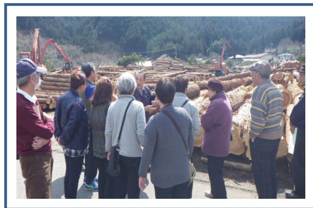
平成 29 年 3 月 18 日 (土) 公民館事業と連携した西川材物語ツアー (吾野原木市場 参加者数 13 名)