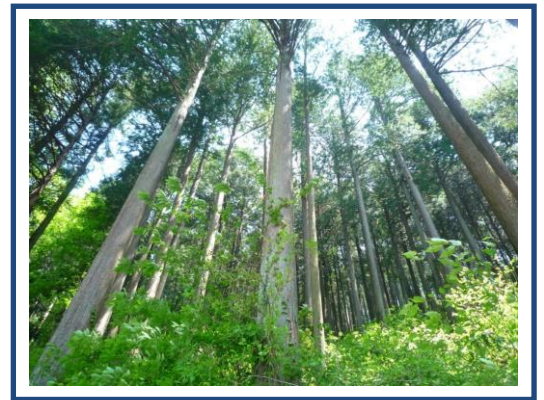
[西川林業地イメージ]

首都圏を中心に使用されている埼玉県産の優良木材で、古くは江戸の大火の復興用材として認知されるようになりました。西川材は、長い伝統と林業者の強い愛林思想に支えられた丁寧な育林作業によって生産されています。本市を中心とする西川林業地は、気象条件や土壌がスギ・ヒノキの生育に適しているため、材の色、艶がよく、年輪が緻密で、節の少ない良質な材が生産されます。