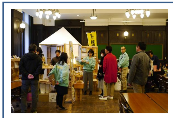
平成 29 年 3 月 11 日 (土)・12 日 (日) 横浜三塔の日 2017 西川材PRブース (開港記念会館全体の来場者数約 2,000 人)