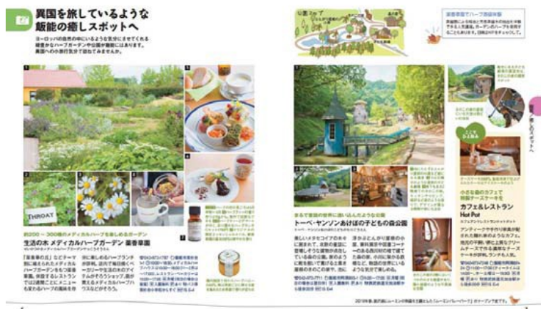
【『ことりっぴ飯能さんぽ』ページ例】